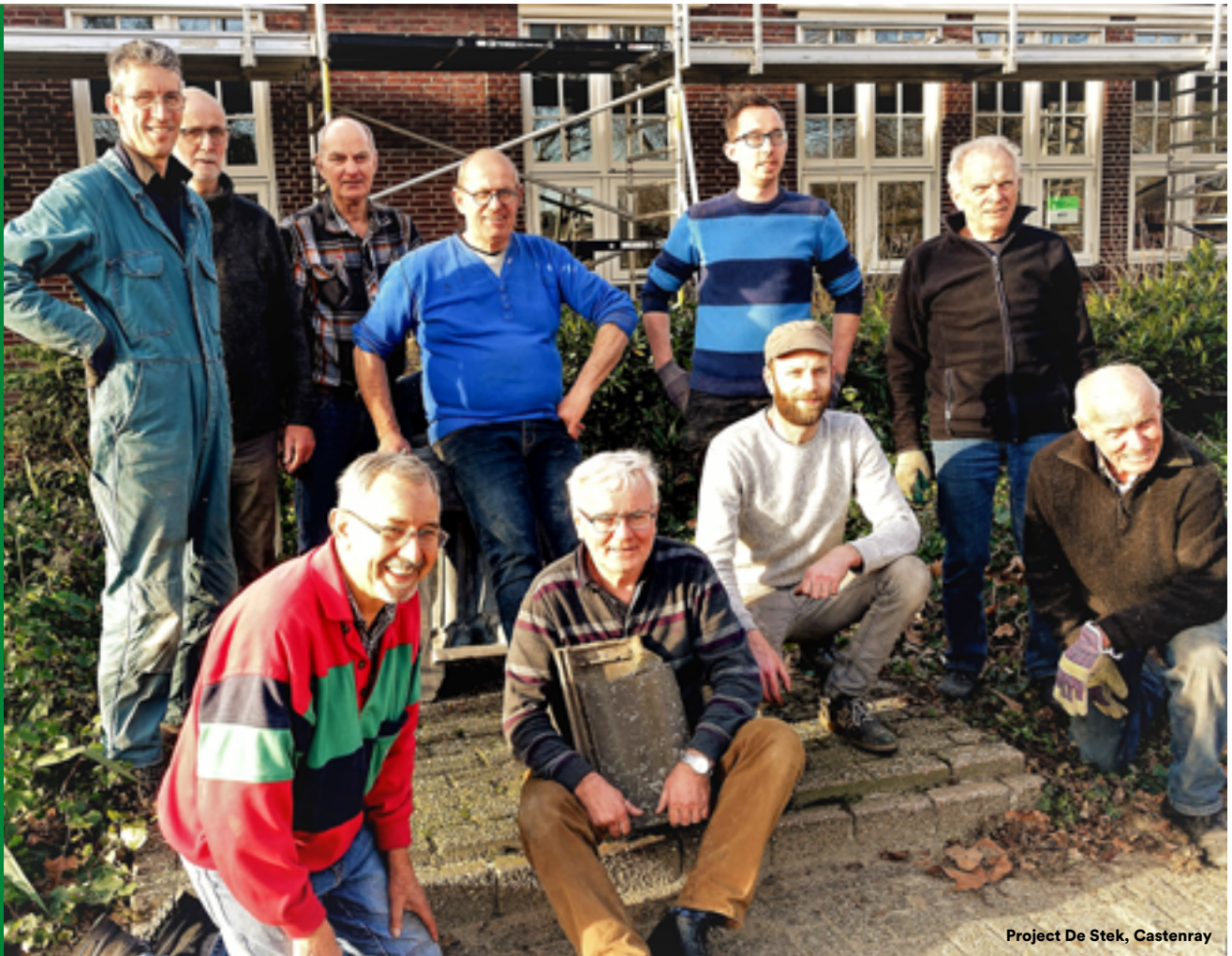
Project De Stek, Castenray