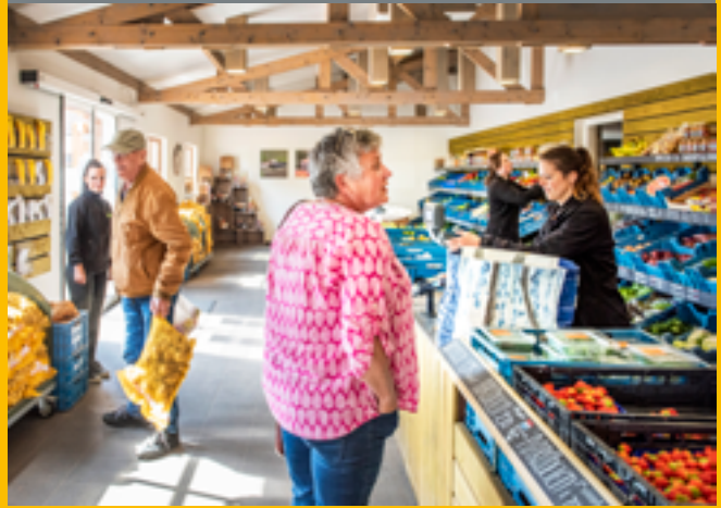
Boerderijwinkel Heijnen in Roggel (L)

Als hoogleraar Inclusieve Plattelandsontwikkeling weet Bettina Bock (62) als geen ander te duiden wat er speelt buiten de steden en waarin de dorpsbewoners vooroplopen.