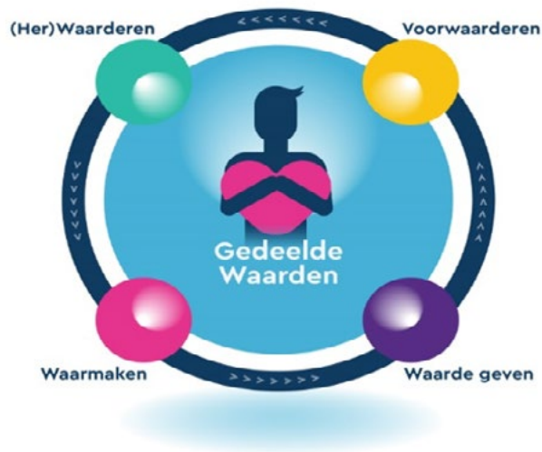
Figuur: De waardencirkel

De waardencirkel was nog erg vanuit beleid ingestoken, moet ik eerlijk zeggen, maar wel met de intentie om het verhaal van inwoners een plekje te geven in de beleidsprocessen en stappen die we maakten.